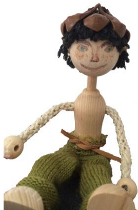
Aha, alles hält!