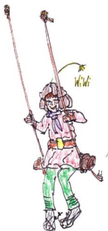
WiWi mit Schaukel

Bei mir stand schon vorher fest, wie die Figur heissen wird, aber was sie alles kann, wurde mir erst bewusst, als die Figur ihre ersten Gehversuche machte.