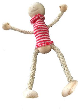
WiWi als Skelett Erste Ankleideversuche.