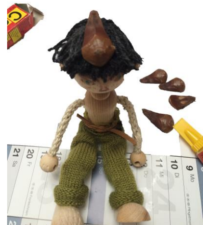
Die ersten Haare wachsen, Kopfbedeckung fixiert.