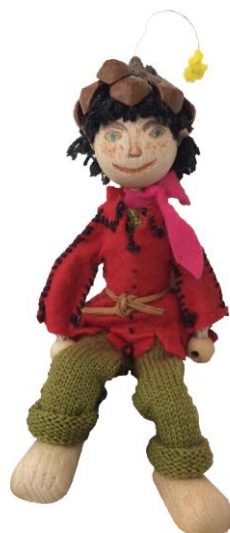
Mantel geschneidert, Sonnenstrahl montiert.