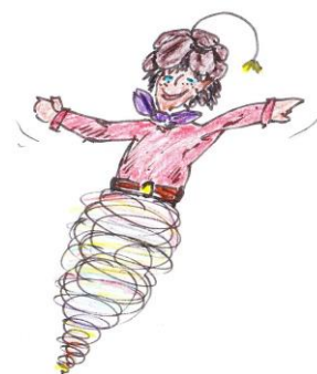
WiWi in seinem Element