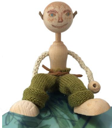
Gesicht; Augen, Nasen, Ohren und natürlich Hosen!