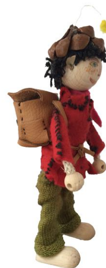
Ein Rucksack braucht's auch!